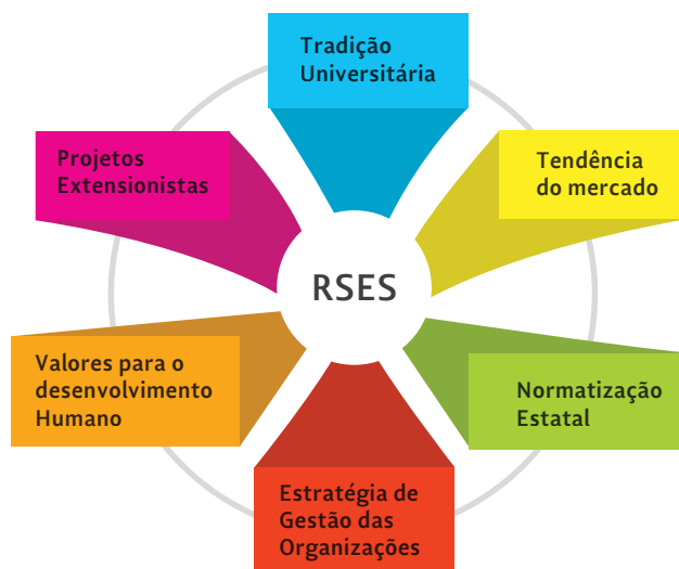
Figura 2 Responsabilidade da Educação Superior: múltiplos enfoques teóricos